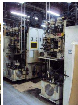
Centros de Usinagem

Os interessados devem se cadastrar no site www.superbid.net e participar do leilão ofertando lances via internet. As fotos e descrições completas dos lotes estão disponíveis no site. Para mais informações os interessados devem entrar em contato com a Central de Atendimento da Superbid, através do Telefone: (11) 2163-7800 ou via e-mail: Este endereço de e-mail está protegido contra spambots. Você deve habilitar o JavaScript para visualizá-lo.