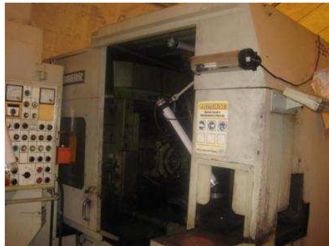
Fresadora Caracol Liebherr L-200

Já o grupo ZF do Brasil, um dos líderes mundiais no fornecimento de sistemas de transmissão e tecnologia de chassis para o setor automotivo, irá leiloar Fresadoras de Engrenagem, Fresadora Caracol, Banco Micrométrico, Durômetro, Retífica de Dentes, Retífica Externa e Veículos no dia 30 de junho a partir das 12h30min. São 25 lotes localizados em Sorocaba/SP, entre os quais podemos destacar: Toyota Filder XE11.8 VVT - I 2007/2008, Fresadora de Engrenagens Pfauter SH300, Máquina Tridimensional Zeinss CN100N-2828-18 MD e Engrenômetro Bammesberg ZBA2.