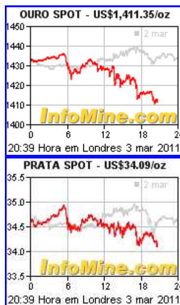
Gráficos gratuitos de commodities

processo proporciona que interessados possam participar de imediato, oferecendo os lances através do site da Superbid www.superbid.net