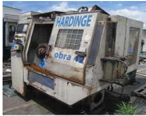
Torno CNC Hardinge Cobra

Máquina de Elevação de Palletes; Máquina de Dureza Wilson; Eletrocalhas; Telhas; Dutos para Exaustão de Gases; Janelas de Alumínio com Vidros; Retífica de Pontas Toss; Retífica Landis; Esteira Transportadora; Torno CNC Hardinge Cobra; Resfriador de Óleo; Forno Combustol; Torno Traub TB42; Tempera de Ponta; Gerador de Tempera Tocco; Bomba de Óleo Hidrocell; Carimbadeira Schimdt; Sucatas de Tornos; Bombas; 20 Servomotores; Redutores; Motores Elétricos; Metálica; Autoclave.