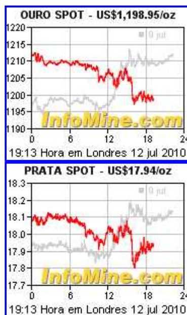
Gráficos gratuitos de commodities

As fotos e descrições completas dos ativos estão disponíveis no site da Superbid. Para ofertar lances, é necessário estar cadastrado e solicitar habilitação – todo o processo pode ser online. Os interessados em conferir os ativos antes da compra deverão entrar em contato com a Central de Atendimento da Superbid, através do Telefone/Fax: (11) 2163-7800 ou via e-mail: cac@superbid.net