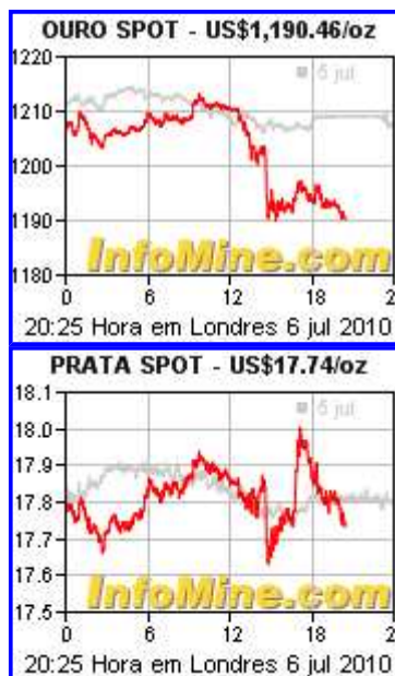
Gráficos gratuitos de commodities

Como Participar: As fotos e descrições completas dos ativos estão disponíveis no site www.superbid.net . Para ofertar lances, é necessário estar cadastrado e solicitar habilitação – todo o processo pode ser online. Os interessados em conferir os ativos antes da compra deverão entrar em contato com a Central de Atendimento da Superbid, através do Telefone/Fax: (11) 2163-7800 ou via e-mail: cac@superbid.net .