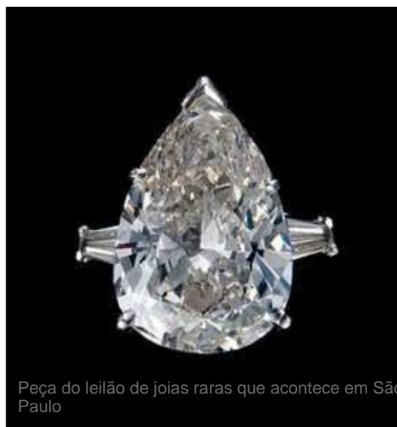
Peça do leilão de joias raras que acontece em São Paulo